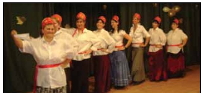
A Süni csoport anyukái itt még suhantak a színpadon, majd a csapat apukákkal kiegészülve fergeteges kalinkába fogott.