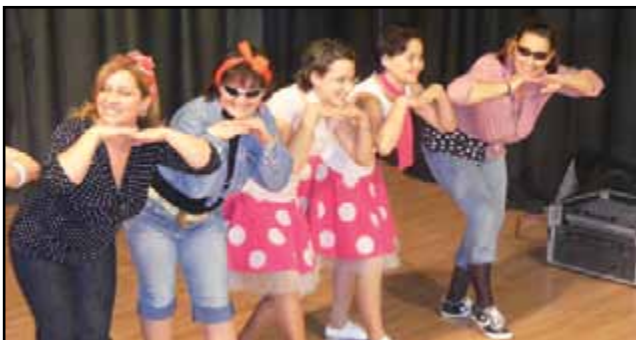
„Ma már a twisttel senki sem viccel...” – Twist, twist – táncolnak a Pillangó csoport anyukái.

Szöveg: Földvári Edit