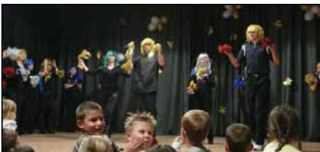
„Gimme, gimme gimme!” – csendült fel a hajdani ABBA-sláger. A disco hangulatát idézték fel a Katica csoportos szülők.