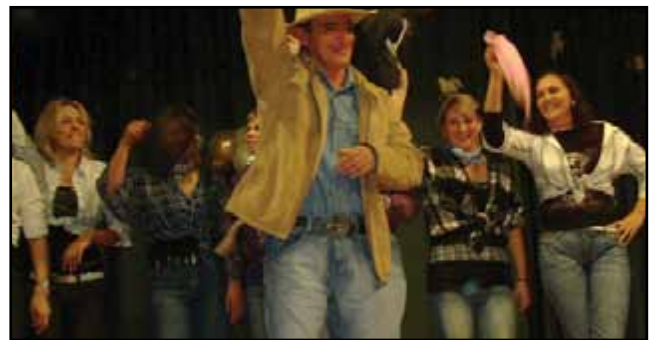
A Csiga-biga csoport szülői közössége country-t táncol.